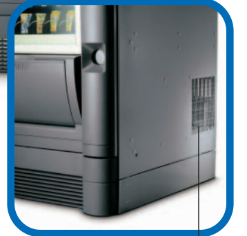
Sıcak hava çıkışı için yan açıklık