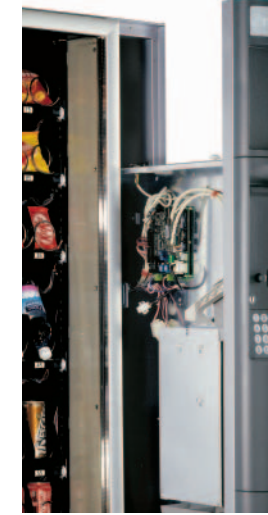
Elektronik kontrol panelini ve ödeme sistemini korumak amacı ile güçlü ayırıcı panel.

Snakky ergonomik servis bölümü (patentli) hırsızlık ve yıpratıcı etkilere karşı korumalıdır. Bu alanın avaşça kapanabilme özelliği vardır. Bu alan oldukça güçlü ve işlevsel tasarlanmıştır. Güvenlik sağlanırken ürünlerin sergilenmesi ve sunulması üst düzeyde sağlanabilmiştir. Bu yeni tip soğutma ünitesi minimum bakım gereksinimi ile , yeni tip kondansatörleri kullanarak (ev tipi), otomat çözümü olarak her türlü gereksinimi karşılar. Ödeme sistemi bölümü ve elektronik kontrol paneli, korumalı ayrı bir bölüme yerleştirilmiştir. Makina operatörler tarafından kontrol edilirken bile içerideki ürün bölümü sıcaklığı korunabilir. Snakky çok çeşitli içeceklerin servisini yapabilir; Snakky' alanındaki başlıca ürünleri sunduğu gibi 0.5 litre PET şişeleri de eğimli şekilde sergileyerek, ekstra aksesuar gerektirmeden sunar.